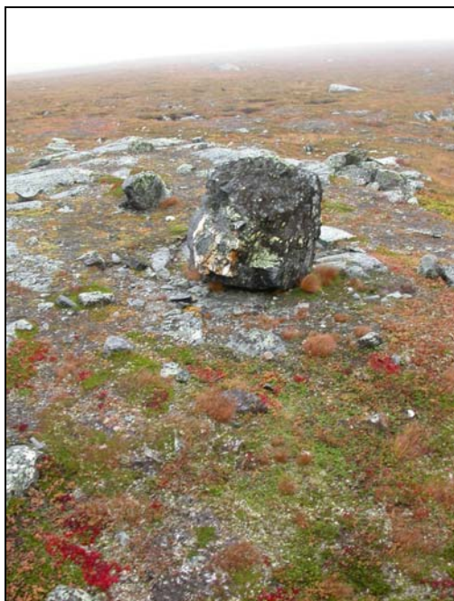
Offerstenen, RAÄ 49, i Offerskalet.

I Riksintresseområdet finns 10 lokaler med fornlämningar registrerade. Vid fältbesöket var det väldigt dimmigt vilket gjorde att lämningarna besiktades från helikopter. Med hjälp av handdator med GPS och inlagda kartor med fornminnesregistret kunde lämningarna lokaliseras. Tre av lokalerna besiktades samt även området runt Blerikstugan . Ingen påverkan eller skada kunde iakttas.