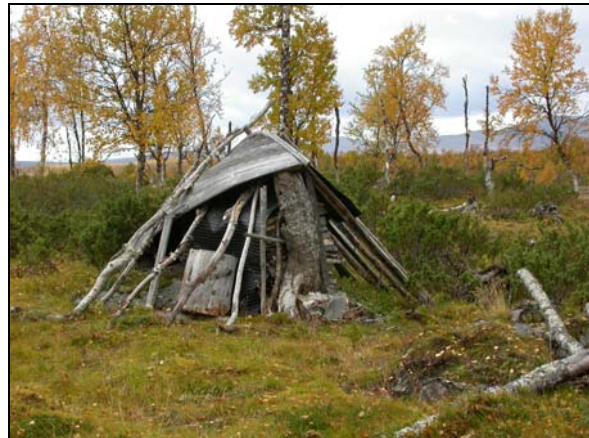
Förråd vid "Skotts kåta"