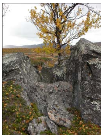
Graven från NV.