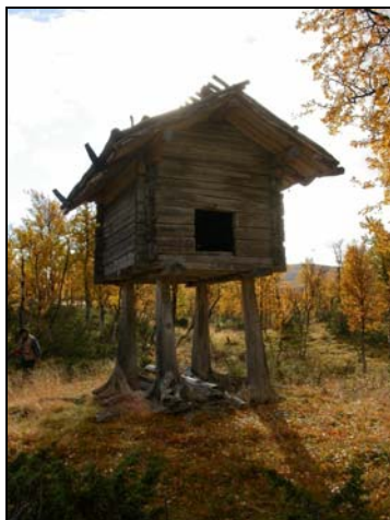
Gåsfotsbod vid Groenienjälla, observera den saknade dörren.