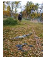
stalot sent härd.JPG