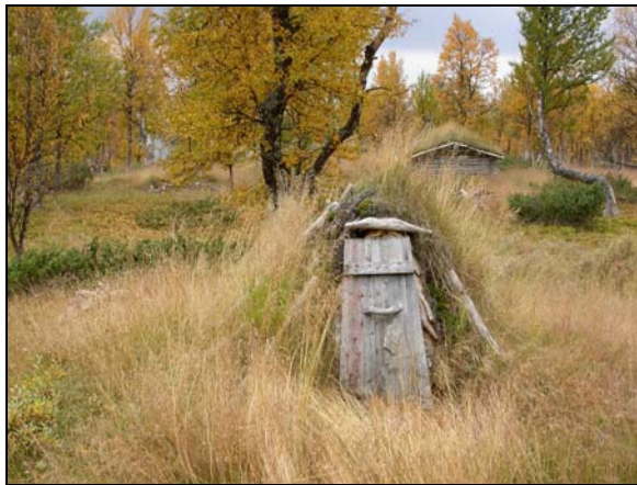
Getkåta vid norra Aunerejaure