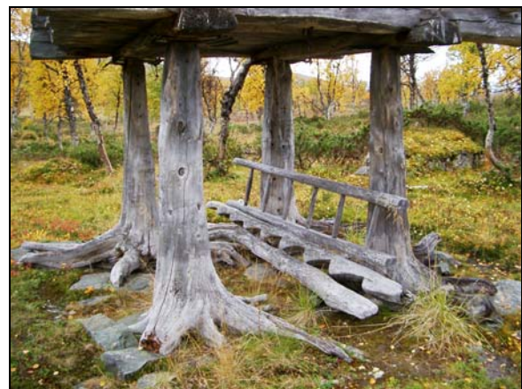
Gåsfötter till Skotts bod