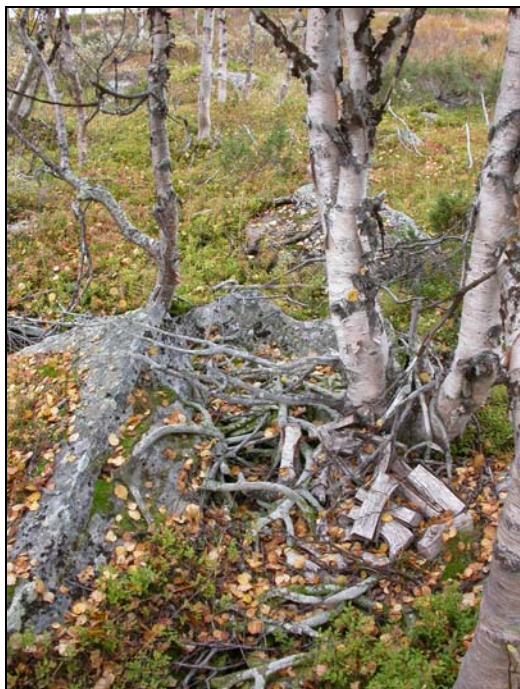
Hornsamling med vedupplag.

I ett område mellan två mindre tjärnar finns 11 hornsamlingar och 1 kåtatomt. Ett mindre vedupplag ligger på en av hornsamlingarna.