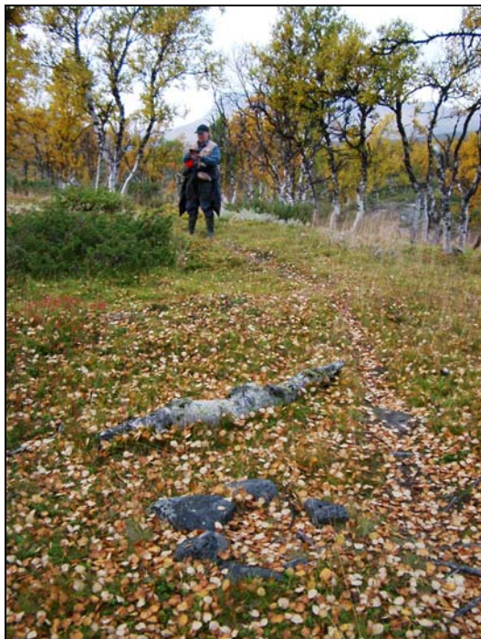
En stalotomt med enbuske i mitten samt en sentida härd i förgrunden med en stig till höger om härd

Vid en grupp stalotomter löper en mindre stig över en av stalotomterna och en sentida härd finns i anslutning.