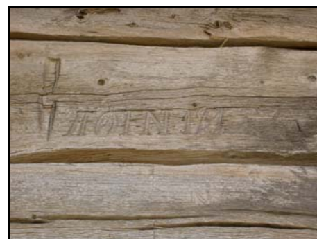
Ristning ovanför dörren AOFN 181