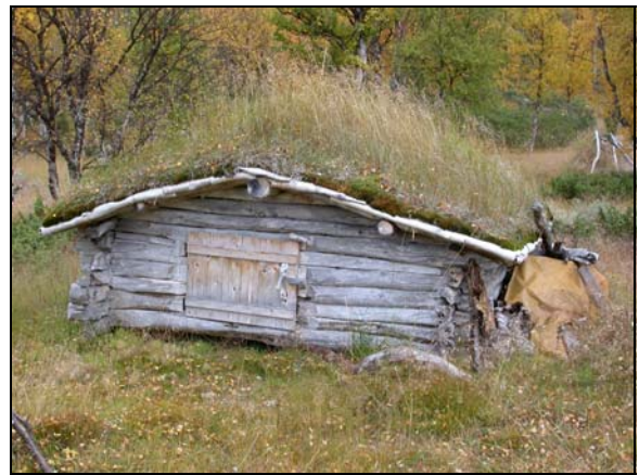
Bod vid norra Aunerejaure