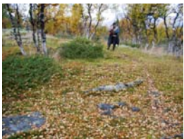
stalo m sent härd.JPG