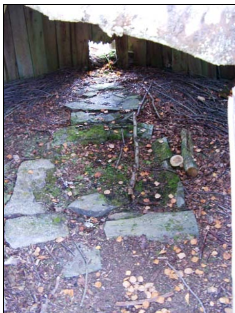
Härden i "Klemet Lars kåta"