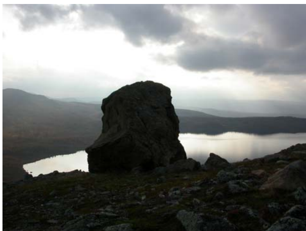
Besiktat block med offerstensliknande utseende. Sjön Aunerejaure i bakgrunden, fotat från NÖ.

Vid fältbesöket gjordes inte någon nyinventering, men ett större block som liknade andra offerplatser besiktades, dock utan resultat. Blocket är beläget på Auneres sydsida.