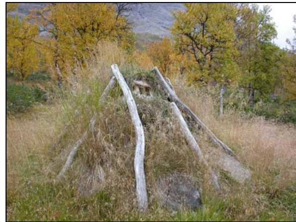
Nedrasat näver och torv på getkåtan