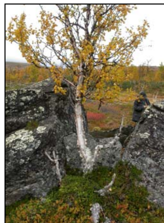
Graven från SO.