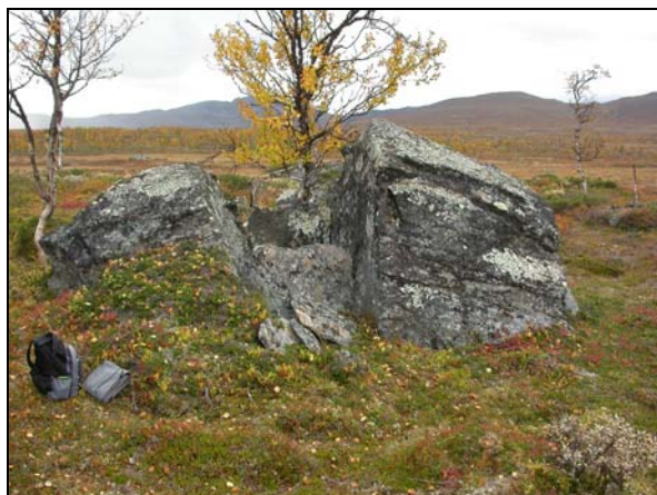
Den mellan två block belägna graven.

I samband med besiktning av RAÄ 1584 och på väg till de hornsamlingar som utgör RAÄ 1585 registrerades en samisk grav belägen mellan två större block. Graven är uppbyggd av ett 15-tal stenhällar och under dessa syns näversjok. Graven kommer att föras in i fornminnesregistret med begäran om att den ej markeras på kartan.