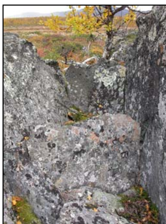
Närbild från NV.