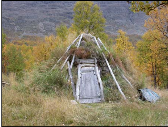
Kåta vid norra Aunerejaure