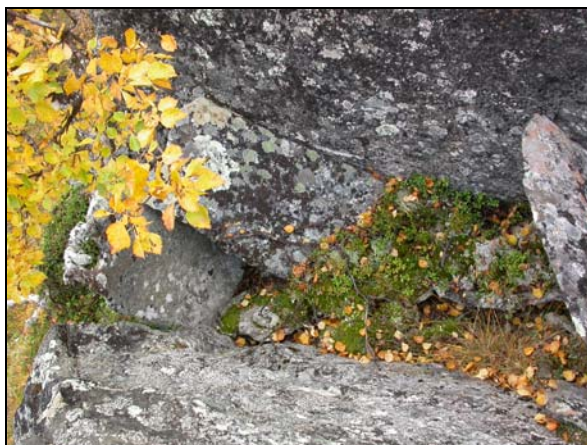
Inrasade hållar i gravens mitt