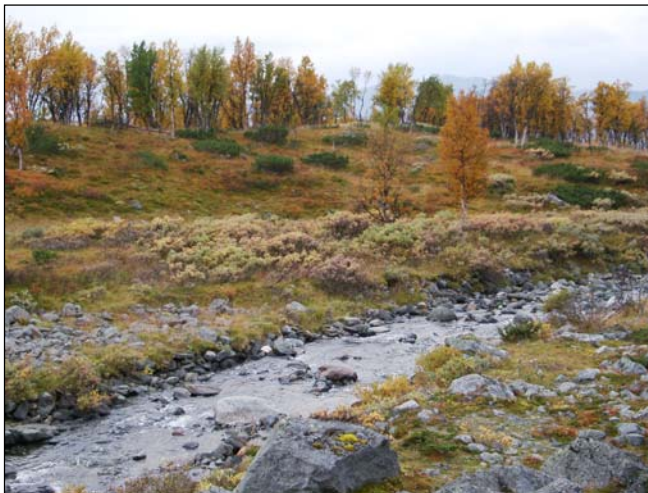
Stalotomterna ligger på åsen på andra sidan av

I ett område mellan två mindre tjärnar finns 11 hornsamlingar och 1 kåtatomt. Ett mindre vedupplag ligger på en av hornsamlingarna.