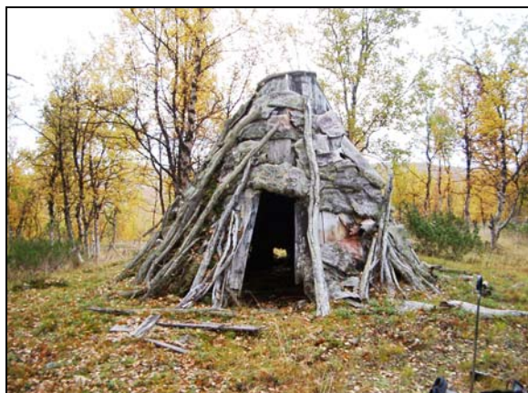
"Klemet Lars kåta", framsida

Den s k Klemet Lars kåta har registrerats vid fornminnesinventeringen som "kåta i förfall". I dagsläget har förfallet fortsatt, inga renoveringsåtgärder har skett.