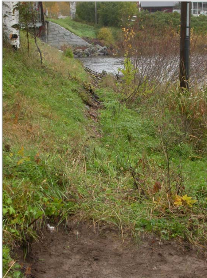
Fig 3. Översikt mot Bure älv från schaktets NV del