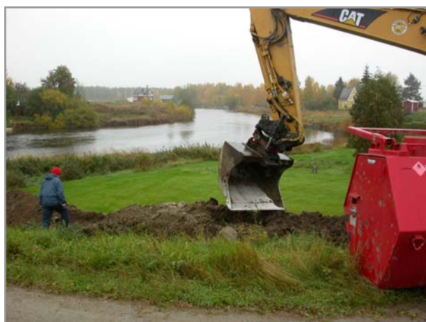
Fig 4. Arbetsbild mot NÖ