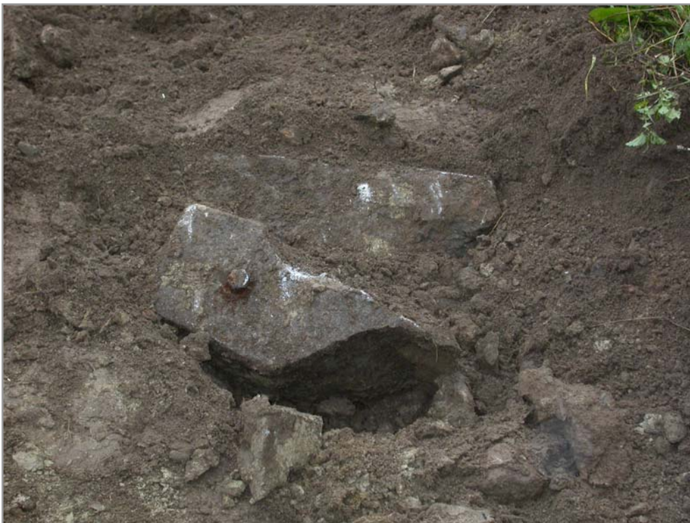
Fig 6. Del av stenfundament