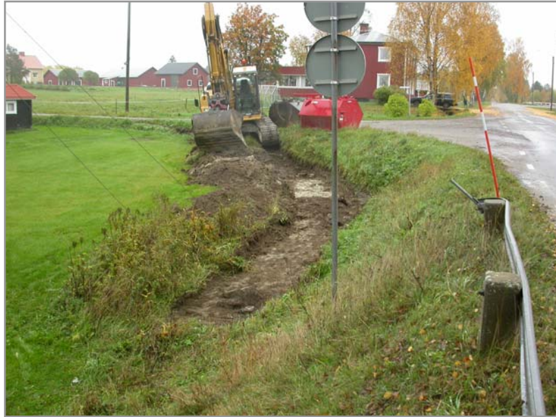
Fig 5. Schakt mot Ö