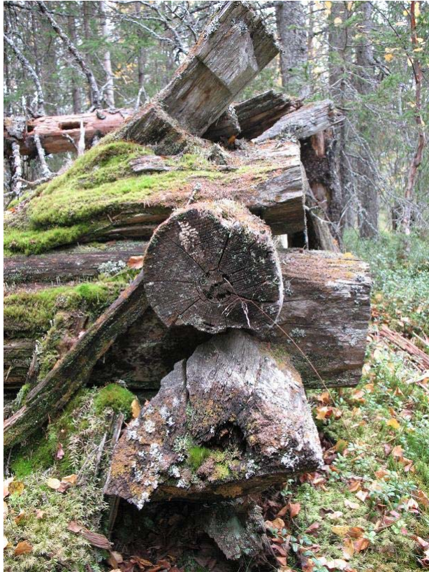
Fig. 3. Nordvästra knuten.

Av byggnaden återstår idag några stockar av timmer. Som mest kan tre stockvarv urskiljas i det NV hörnet och där framgår det också att stugan är byggd av rundtimmer. Av nedfallna takbjälkar att döma har byggnaden bestått av två rum, ett större i norr och ett mindre i söder. I det södra rummet finns en mycket välavgränsad, rektangulär upphöjning, 1,5 x 1,0 meter stor och 0,4 meter hög, nu bevuxen med mossa. Under mossan syntes rester av kol. Eftersom inga stenar efter någon murstock kunde noteras antas detta ha varit en eldpall. Då byggnaden är kraftig söndervittrad och dessutom bevuxen med många ungräd var det