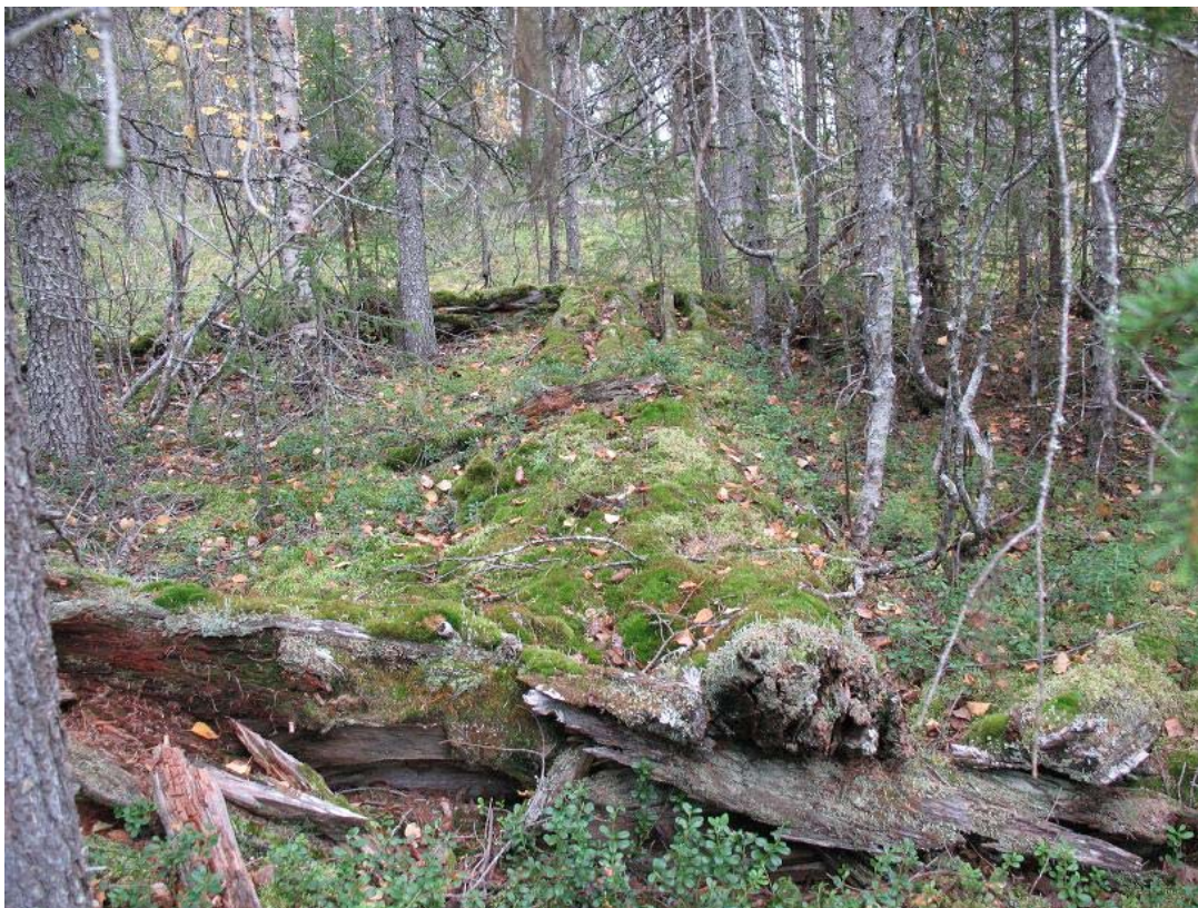
Fig. 6 Nedfallen takås tvärs över byggnaden, foto från väster.