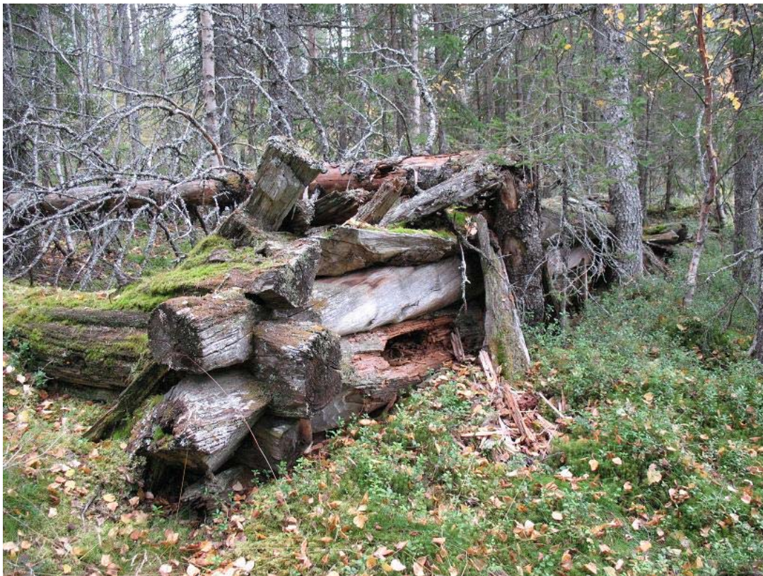
Fig. 2 Nordvästra hörnet på kojans.