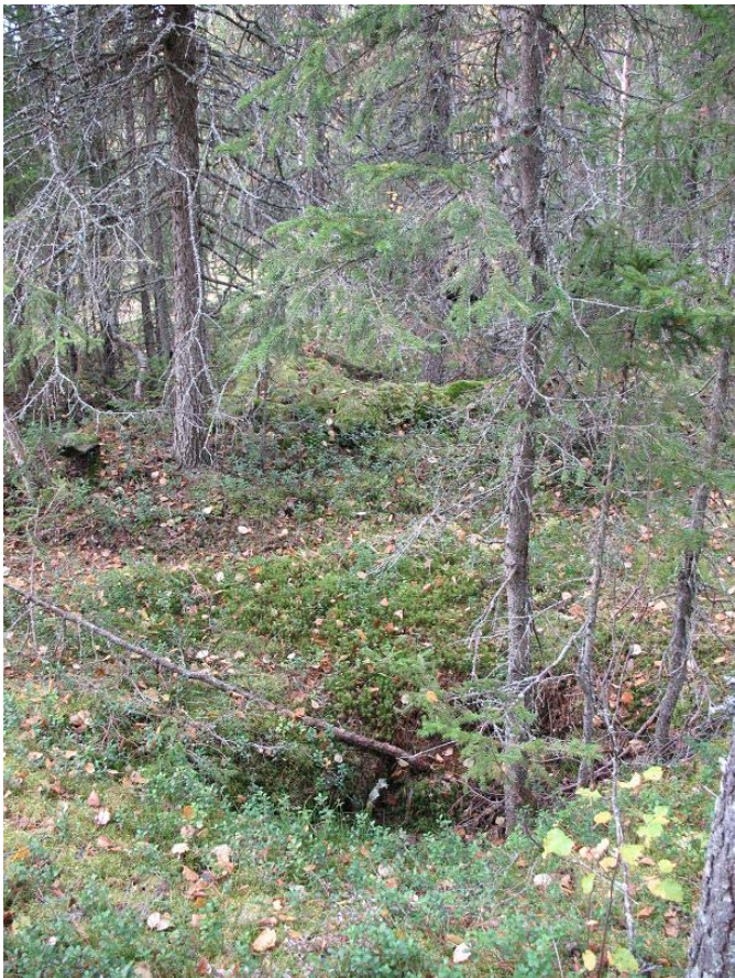
Fig. 7. Sydöstra hörnet med troligtvis en eldpall i mitten på bilden, se pil.

Cirka 1,5 meter öster om byggnaden fanns en grop som var 1,5 x 0,5 meter stor och 0,5 meter djup. Funktionen är okänd.