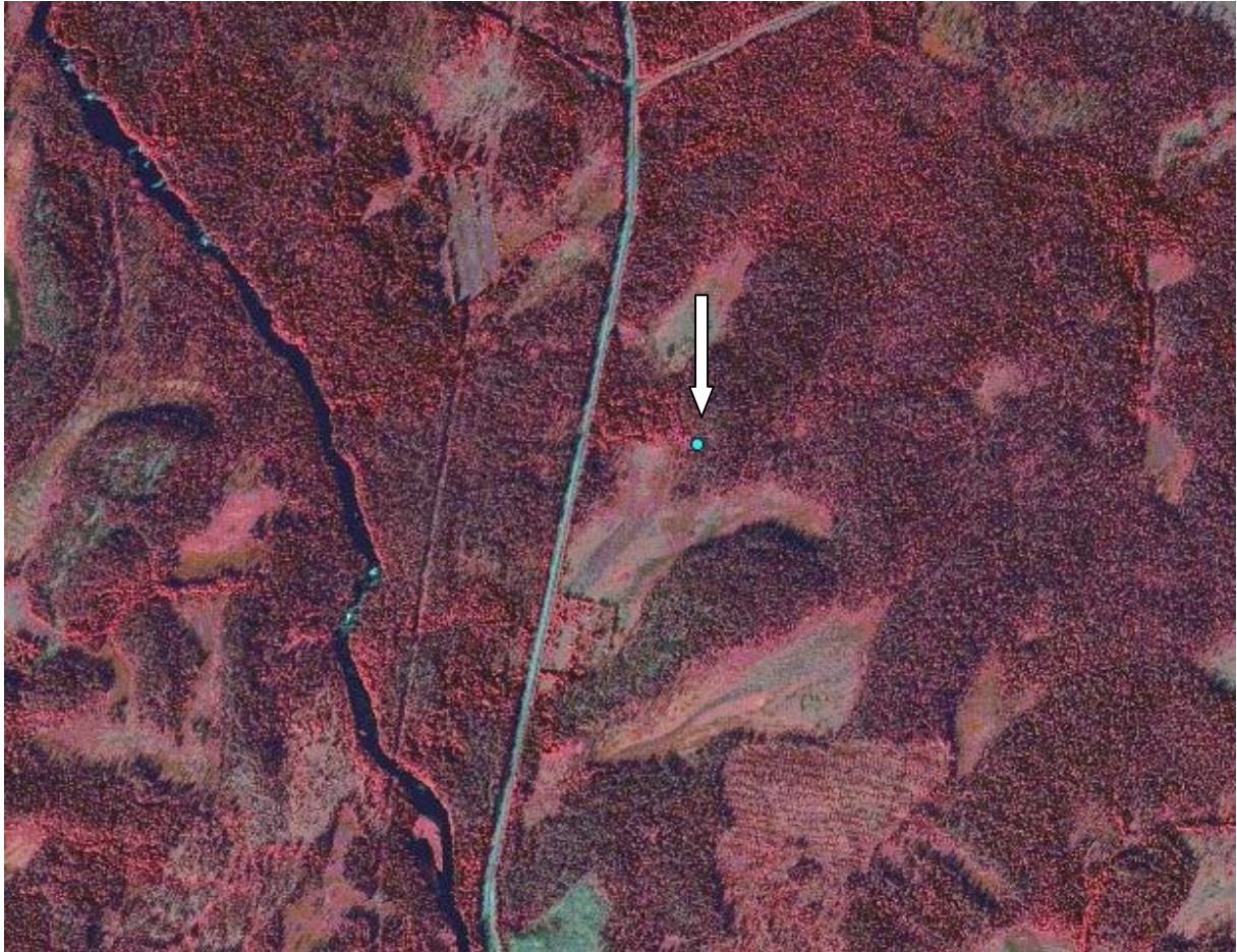
Fig. 9. Karta över området i skala 1:10 000 med byggnaden markerad med pil och en blå prick. Ekonomiskt kartblad: 22f4j.

Nedanstående karta visar vart timmerbyggnaden påträffades, ca 1,5 km ovanför vägkorsningen Storbäck/Högland. Den bäck som kan ses på bilden är Gitsån.