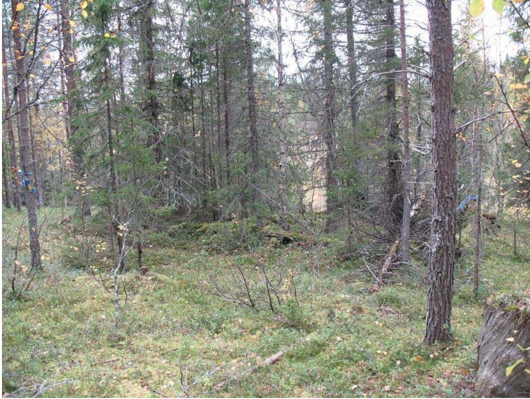
Fig. 1 Kojan fotograferad från NÖ och med myren i bakgrunden.

Y 1497813. I backen på den östra sidan om byggnaden växer idag gles tallskog. Högstubbar i området vittnar om avverkning här för länge sedan.